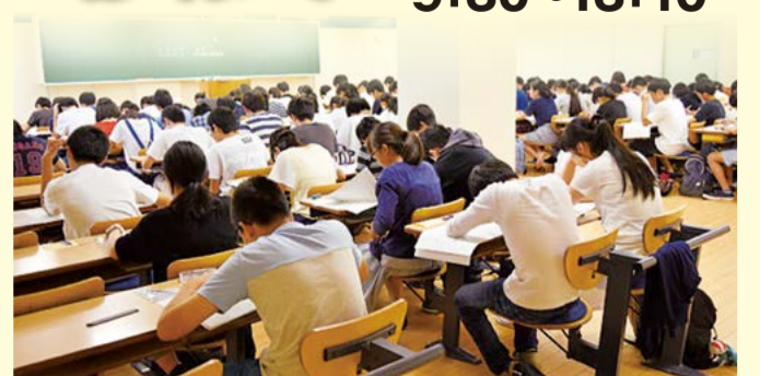
※本テストで合格基準点に達すると、水戸アカデミーの入塾選抜試験が免除となります。

テスト後、答案をもとに学習カウンセリングを受け付けます。点数の良し悪しだけでなく、問題へのアプローチや家庭学習の仕方など、受験指導に携わるプロの講師が様々な角度から分析しアドバイスします。